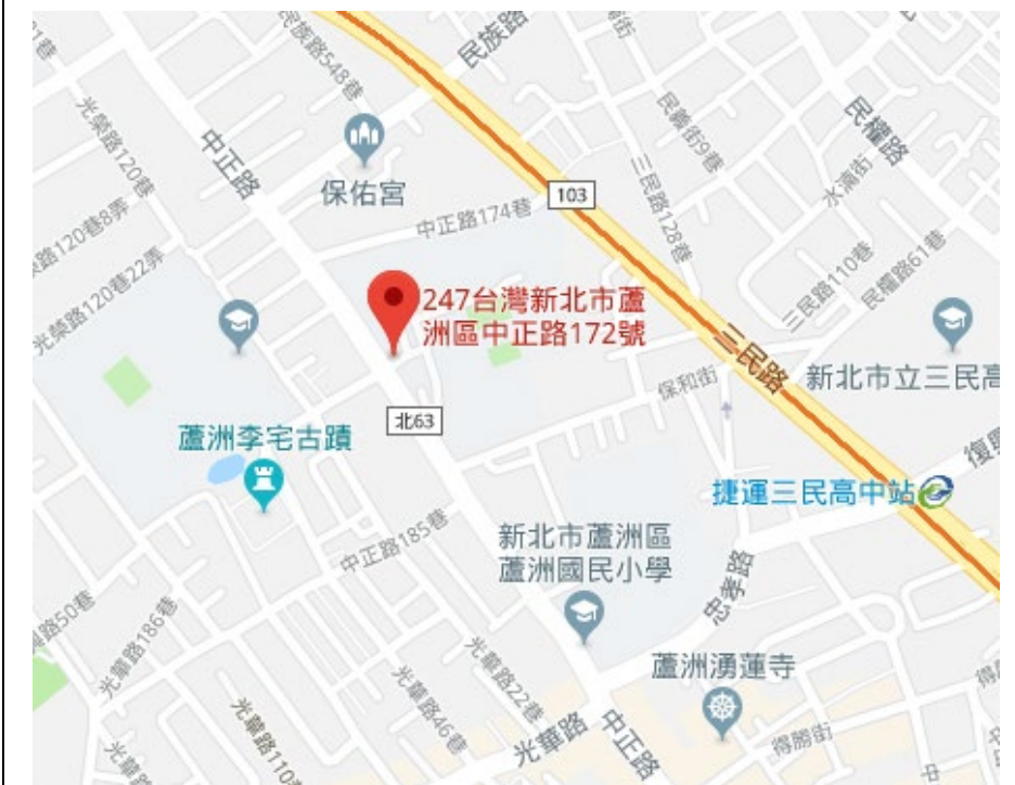
國立空中大學蘆洲校本部平面圖