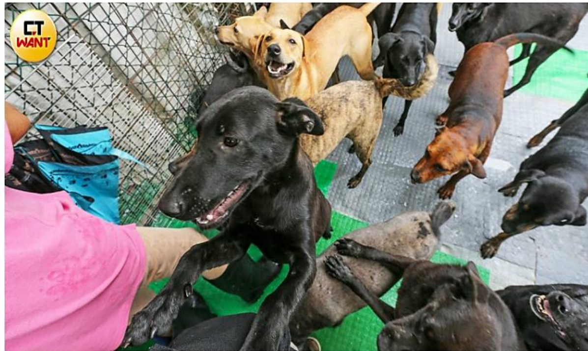
台灣民間有許多「愛爸、愛媽」獨力成立園區，收容流浪犬貓，但資源有限，還得面臨斷糧危機。(圖／本刊資料照片)