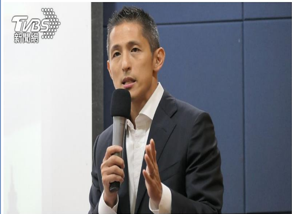
民進黨立委參選人吳怡農。