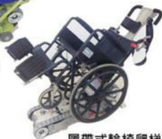
履帶式輪椅爬梯機