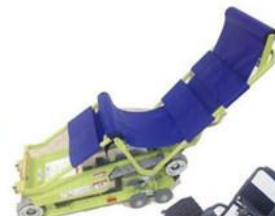
履帶式座椅爬梯機